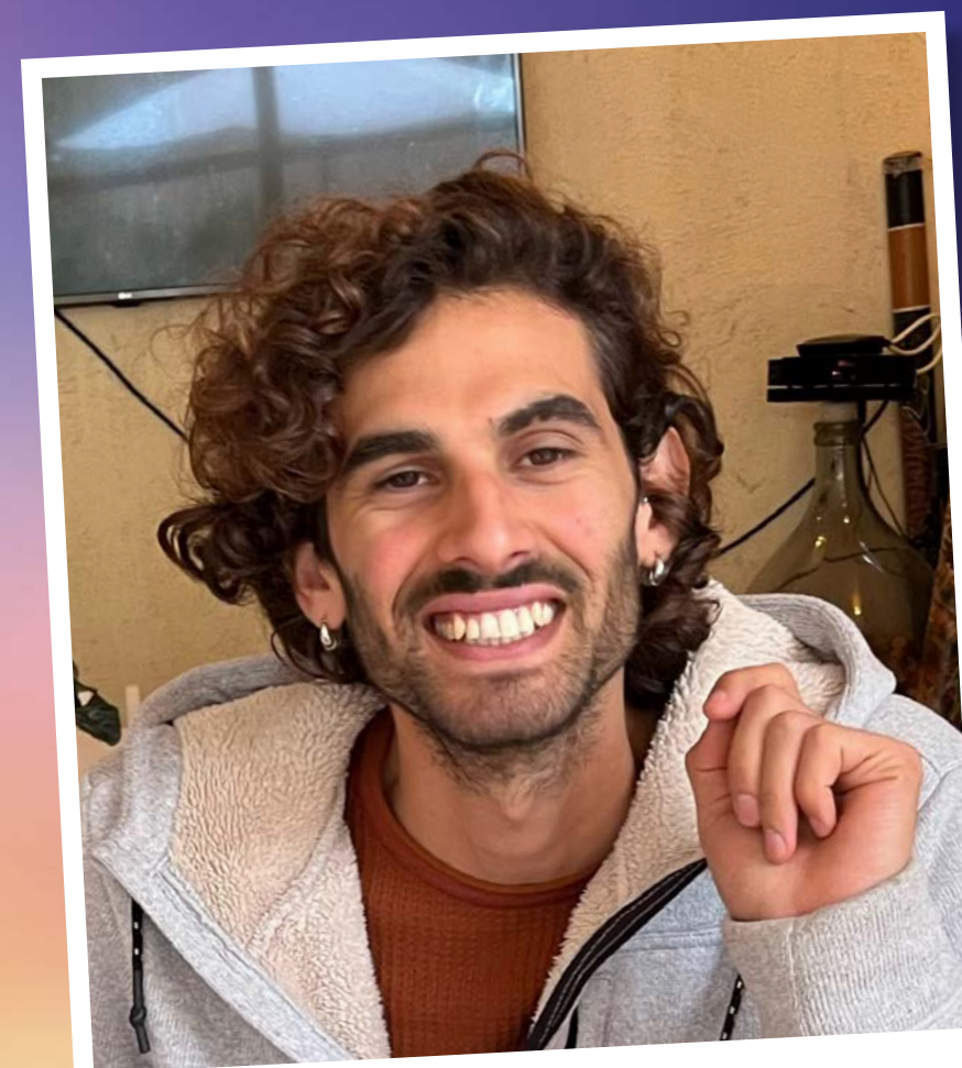
אבן שנים מחלב

(אור הצפון חלק א - מאמר "המלכת את חברך")