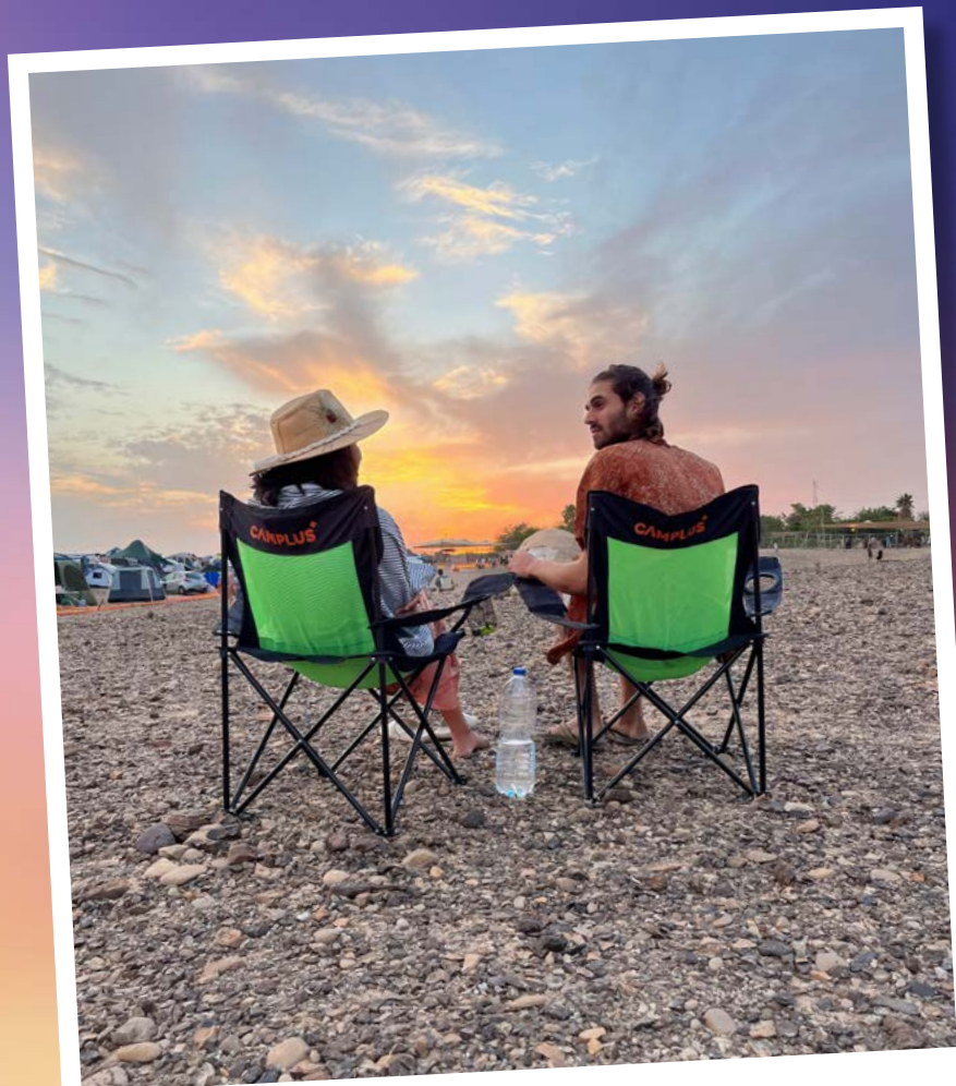
אדם לבואו עיני

מה העזרה הכי גדולה שאני יכול להעניק לאחר, עזרה פיזית או עזרה נפשית?